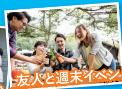
友人と週末イベント